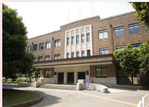
大学本館および徽音堂 ※登録有形文化財(建造物):文化庁 住所:東京都文京区大塚2-1-1

17:10～17:30 学生寮見学「学部1,2年生向け学生寮 お茶大SCC」 ※定員制のため事前の申し込みが必要です。 ※第一部のみの参加も可能です。